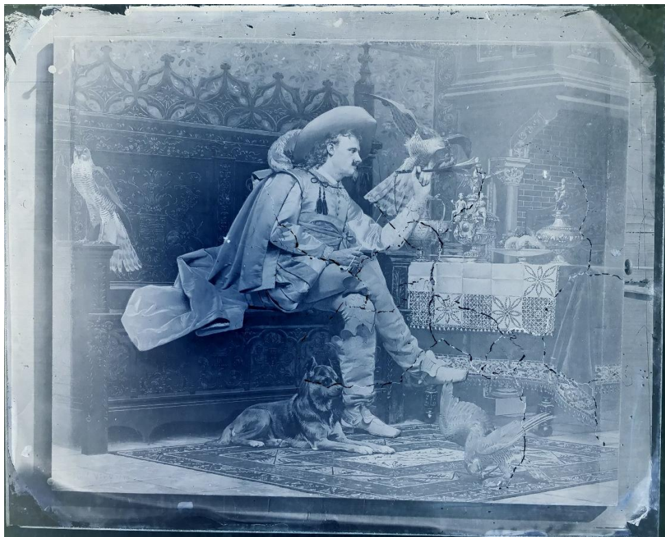
Retour de la chasse 1877, plaque photographique, archives de l'artiste ;

On constatera que l'attitude du personnage est semblable à celle du « Fauconnier aux trois faucons », avec le chien-loup à ses pieds. On reconnaît le type de rambarde néo-moyen-âge de la terrasse souvent représentée dans d'autres tableaux. En arrière-plan, on découvre un bord de mer avec une plage. »